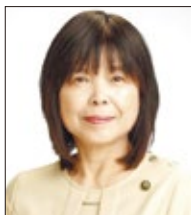
富高 国子 市長

R7.1.1 住民基本台帳人口：総人口…64,450人 男…30,181人 女…34,269人 世帯数…32,730世帯 R7.1.1 総面積…903.14km 2 公共施設数(令和5年度)：小学校…22校 中学校…15校 出典：令和7年度版 大分県市町村ハンドブック