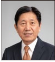
川野 文敏 市長

R7.1.1 住民基本台帳人口：総人口…31,998人 男…15,024人 女…16,974人 世帯数…15,506世帯 R7.1.1 総面積…603.14km 2 公共施設数(令和5年度)：小学校…11校 中学校…7校 出典：令和7年度版 大分県市町村ハンドブック